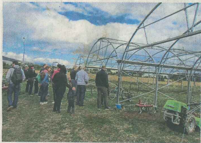
Les nouvelles serres en construction visitées.

La Section d'aménagement végétal d'Alsace (Sava) a fêté son trentième anniversaire ce week-end, par un dîner-cabaret le samedi et des portes ouvertes aux Jardins du Giessen le dimanche.