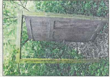
Attention, cette porte ne symbolise pas l'entrée du parcours.