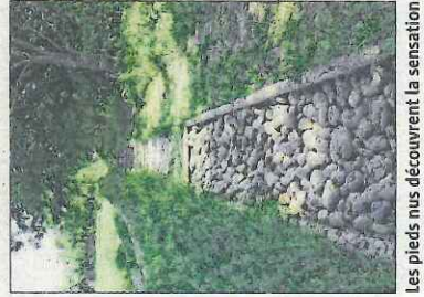
Les pieds nus découvrent la sensation de marcher sur des galets, des graviers, du sable ou de l'argile.