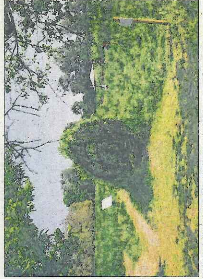
Le sentier démarre sur l'herbe, tout en douceur.

Y ALLER Sensoried, 35 rue Ehnwîhr à Muttersholtz (à l'arrière de la Maison de la Nature). Parcours libre, ouvert en autonomie tous les jours à partir de 9h. Bouvette et produits anti-moustiques conseillés.