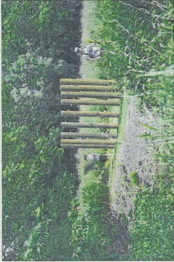
Long d'1,5 kilomètres, le sentier emmène le visiteur au cœur du milieu naturel riedien.

Les pieds sont à nouveau sollicités un peu plus loin, invités à remonter les temps géologiques en marchant sur des galets, des graviers, du sable et de l'argile, qui composent le sous-sol de la plaine d'Alsace. La balade se poursuit de l'autre côté du cours d'eau, en altitude, où les pieds nus ont l'opportunité d'emprunter l'ancienne voie de chemin de fer. Ici passait le train