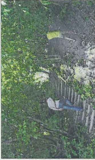
Deux moyens possibles pour rejoindre l'ancienne voie de chemin de fer.

Au milieu du parcours, entre deux murmures d'oiseaux ou d'êtres humains au loin, le visiteur a tout