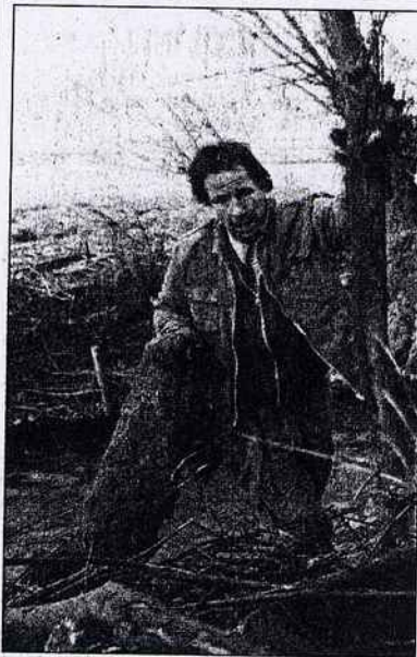
Au bord de la Largue, l'un des trois chantiers de la Sava en cours dans le Haut-Rhin.

L'agence de l'eau Rhin-Meuse remet aujourd'hui ses trophées et médailles de l'eau à Metz. L'Alsace se retrouve au tableau d'honneur à travers plusieurs récompenses. Parmi les lauréats, la section d'aménagement végétal d'Alsace, la Sava. Faire de la réinsertion en s'occupant d'environnement, c'est le pari lancé il y a douze ans par la fédération Alsace Nature, en créant cette section, basée à Muttersholtz près de Sélestat, qui emploie aujourd'hui cinq salariés et une dizaine d'autres personnes.